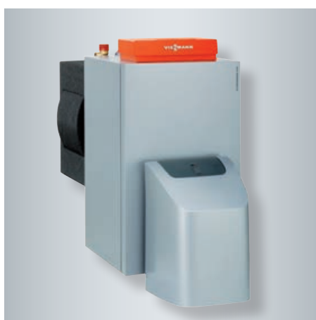
Vitorondens 200-T de 67,6 à 107,3 kW